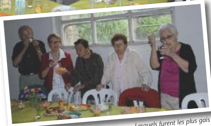
Lesquels furent les plus gais ?