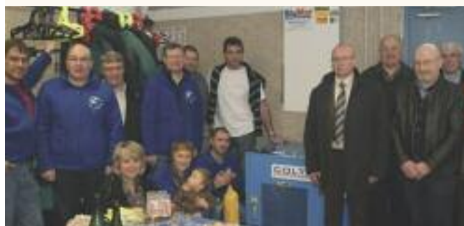
Inauguration du nouveau compresseur.