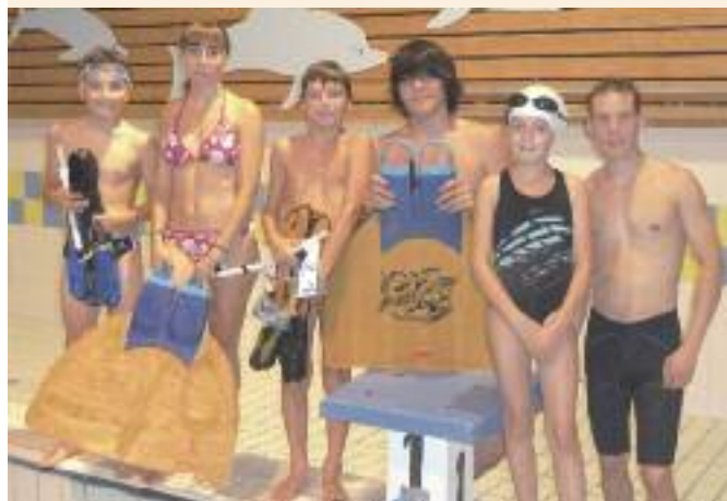
Une partie de l'équipe de nage avec palmes.

Nous les en remercions, sans eux cet achat n'aurait pas été possible.