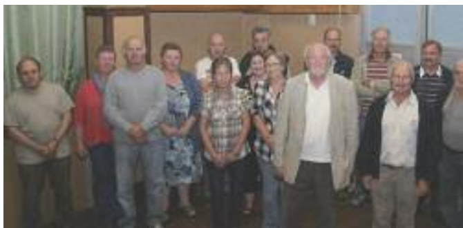
Le nouveau Comité et son Président.

Au cours de notre Assemblée Générale du 2 juillet nous avons constitué notre nouveau Comité et celui-ci a élu son nouveau Président. Je remercie encore tous les membres et bénévoles qui ont su rester unis dans l'espoir de pouvoir redonner à notre Société ses lettres de noblesse et son succès, en mémoire de nos anciens.